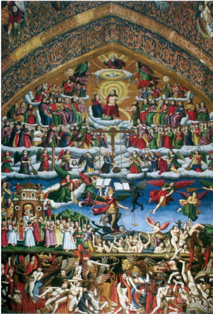
Հատուցման դատաստան, 1669 թ.,

Որմնանկար, Սուրբ Ամենափրկիչ Եկեղեցու Սուրբ Հովսեփ եկեղեցի, Նոր Ջուլա, Իրան