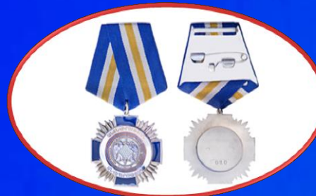
«Անձնվիրություն և անվիհերություն» մեդալ