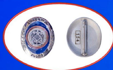
«Լավագույն քննիչ» կրծքանշան