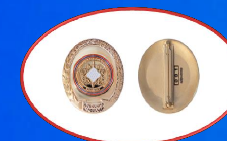
«Պարվաճար գործընկեր» կրծքանշան