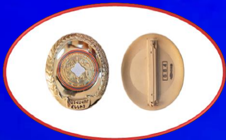
«Պարվաճար քննիչ» կրծքանշան