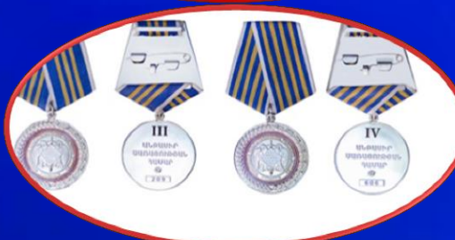
«Անբասիր ծառայության համար» մեդալ