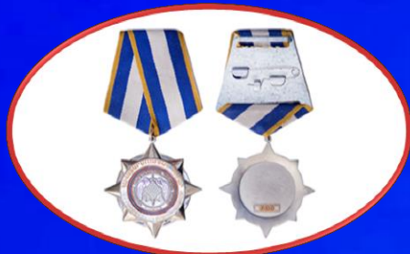
«Հախարարմության համար» մեդալ