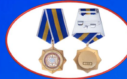
«Վաստակի համար» մեդալ