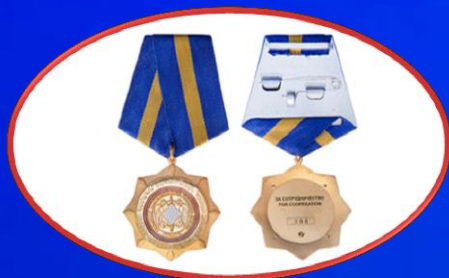
«Համագործակցության համար» մեդալ